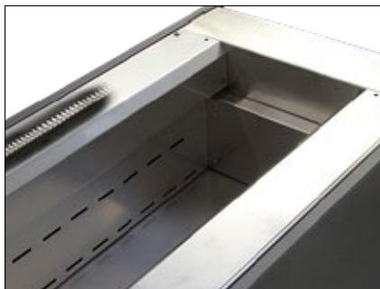
Detalle del baño de agua de acero inoxidable con la protección de los husillos de bolas de accionamiento lateral, también de acero inoxidable.

Este modelo satisface plenamente y supera los requisitos de las normas ASTM D113, ASTM D6084, AASTHO T51 y EN 13398. Para obtener los 25°C requeridos con una tolerancia de \pm 0,2^{\circ}\text{C} , es necesaria la recirculación de agua fría. Un enfriador de agua (véase el accesorio 81-PV1002) es ideal para ello y puede que ya esté disponible en el laboratorio, pero también puede utilizarse agua de la red. Si la temperatura ambiente supera los 25°C, como en las zonas tropicales, y no se dispone de agua fría de red, es obligatorio el uso de un enfriador de agua.