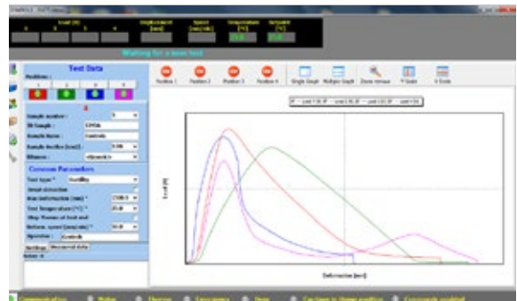
Típica captura de pantalla del software de la máquina

Acceso fácil y libre a la gran zona de ensayo, común en todas las versiones