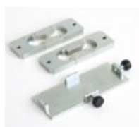
Moldes de probetas

Molde de probetas conforme a la norma EN 13389