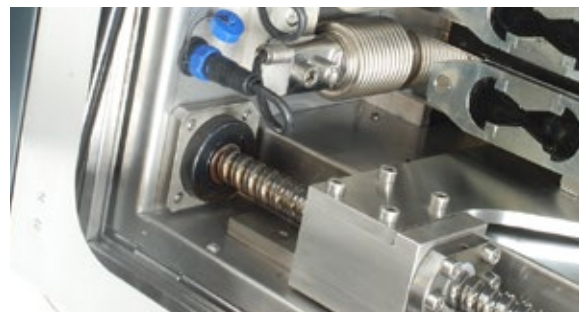
Detalle de 81-PV10B02 y PV10C12 con cuatro células de carga 81-PV10020 y moldes de probetas